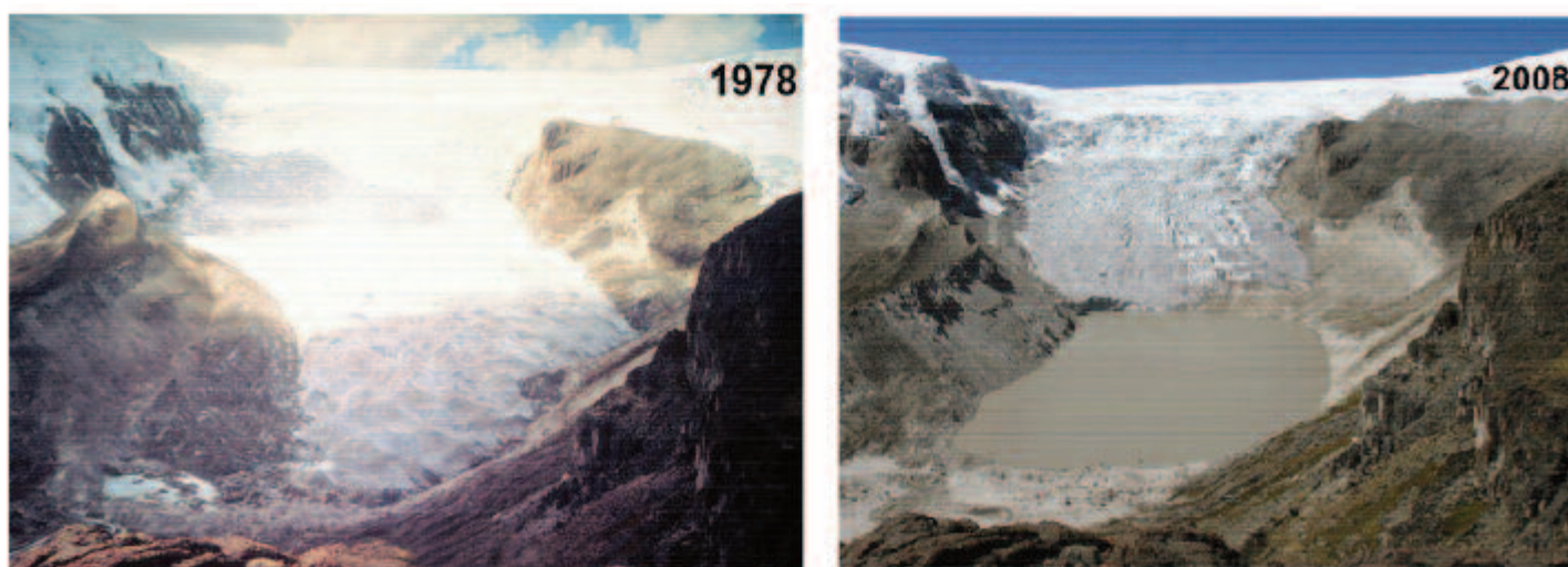
Ghiacciaio di Qori Kalis (il più grande ghiacciaio della calotta di Quelccaya nelle Ande meridionali del Perù).

I ghiacciai sono estremamente vulnerabili al cambiamento climatico in corso