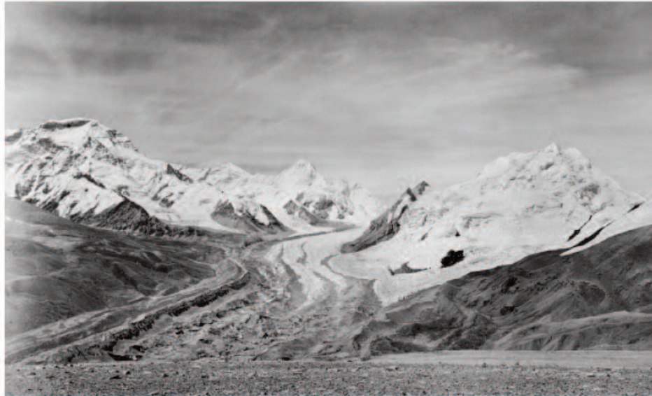
Ghiacciaio di Kyetrak 1921. Posizione: Cho Oyu, 8201 m, Regione Autonoma del Tibet; Himalaya Orientale. Altitudine del ghiacciaio: 4.907 - 5.883 m.

Il regresso dei ghiacciai richiede interventi immediati