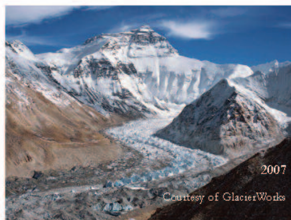
Ghiacciaio principale di Rongbuk