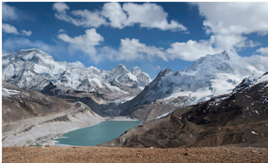
Ghiacciaio di Kyetrak 2009; Fotografia 2009: per gentile concessione della Glacier Works